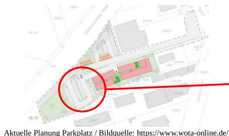
Aktuelle Planung Parkplatz

Der aktuell als Ärzt:innenhaus genutzte Klinkerbau mit der Adresse Graßdorfer Straße 13 soll perspektivisch abgerissen werden. Der städtische Unternehmensverbund WOTa will unweit ein neues Gebäude für Arztpraxen und andere gesundheitsbezogene Angebote errichten 1 . Der Tauchaer Stadtrat hatte am 17.06.2021 dazu einen Aufstellungsbeschluss 2 und am 14.10.2021 die Auslegung des Bebauungsplans beschlossen 3 .